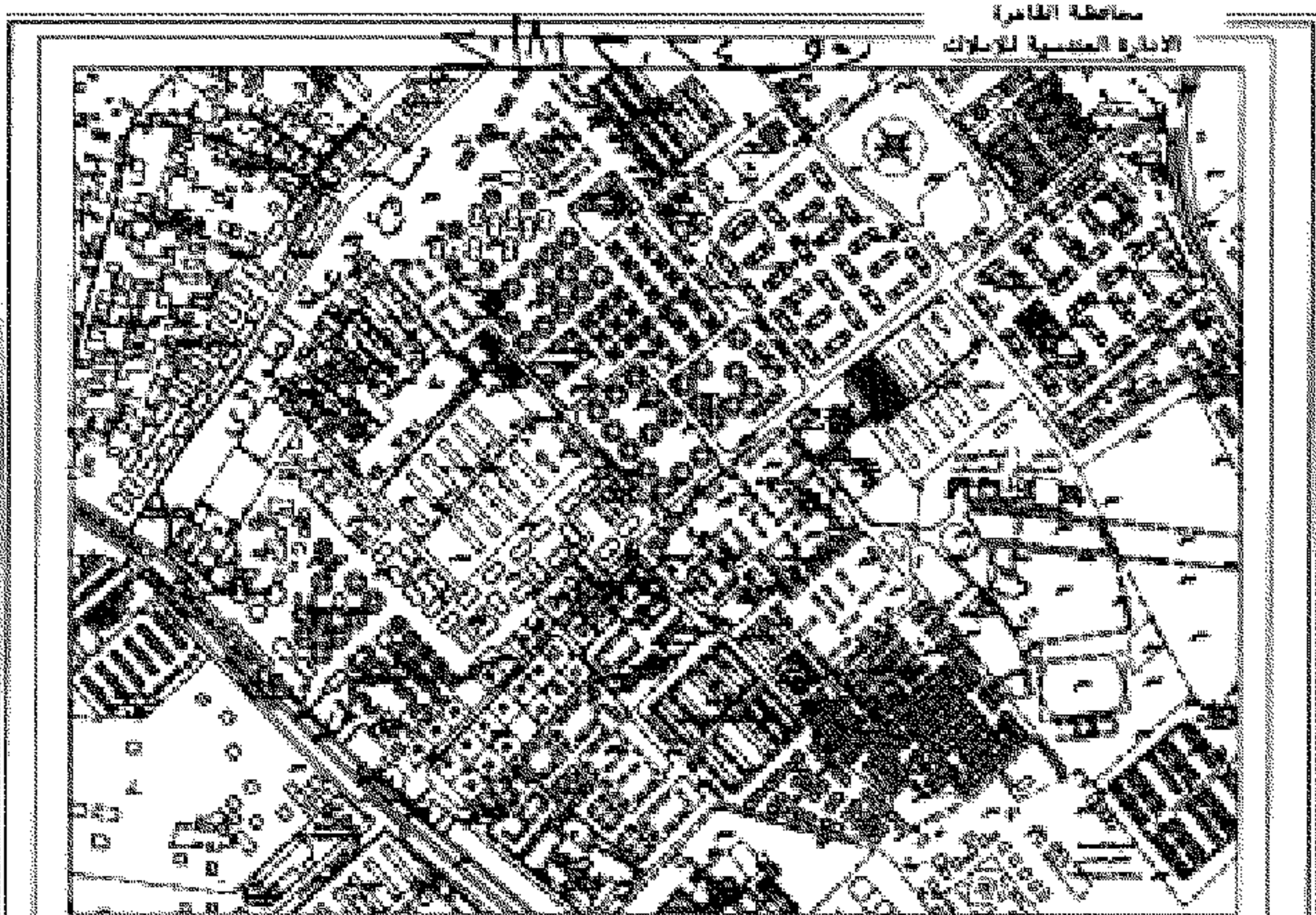
جزء من الشرائط المساحية لرقم ٣١٠-٣١١-٣١٢-٣١٣