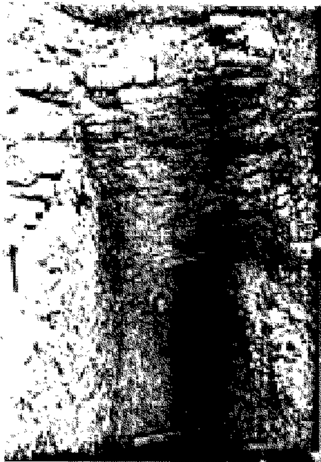
مزارع صلالة في ولاية مسقط