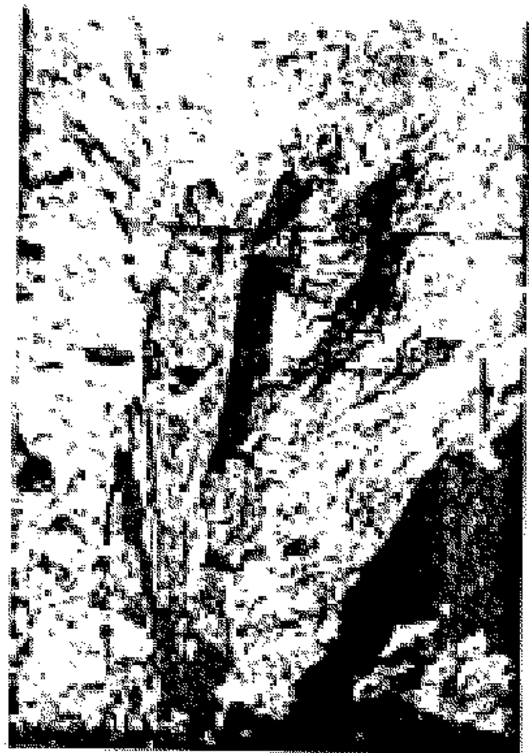
مزارع صلالة في ولاية مسقط