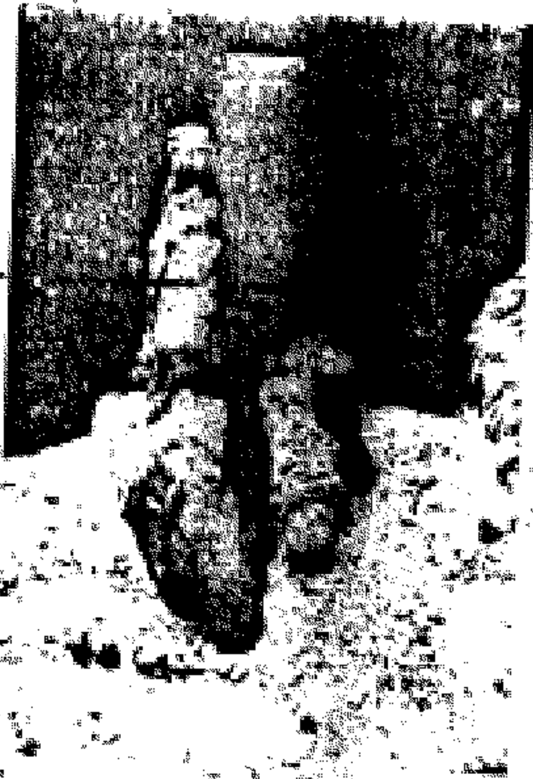
مزارع صلالة في ولاية مسقط المحافظة بمحافظة مسقط مسقط (القطر مسقط)