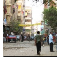
جهود دون التوقعات: التعامل مع المناطق العشوائية