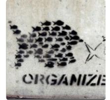
ائتلافات المجتمع المدني في مصر