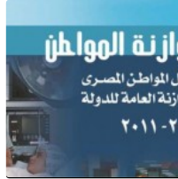
شفافية الموازنة وموازنة المواطن في مصر