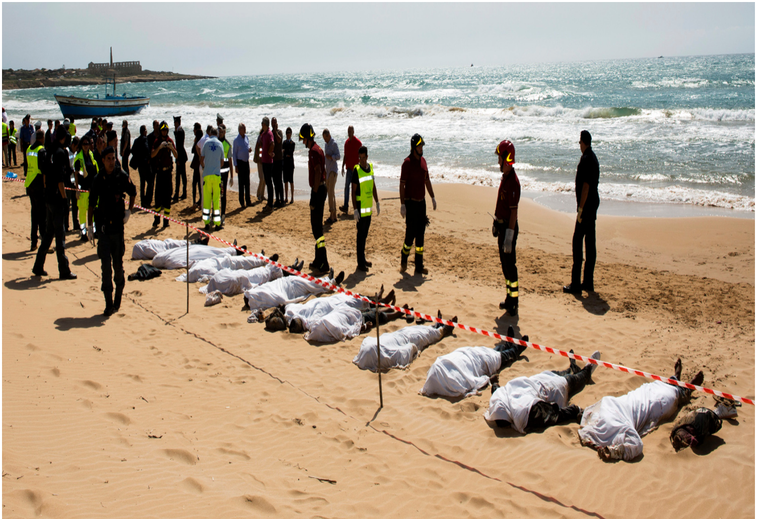
ملقظم ائتمن 170 يها لولؤ 178